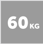
BALLEN- GEWICHT KARTONAGE