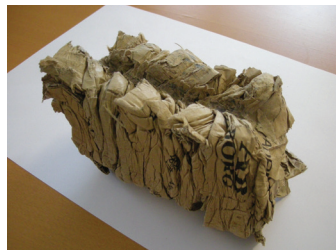
Kleines und kompaktes Brikett