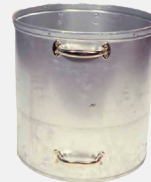
Separater Stahlzusatzbehälter für besonders sicheres Handling von beispielsweise Dosen und Gläsern nach der Verdichtung.