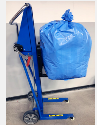
Die Orwak Hebekarre macht die Bedienung noch bequemer und Schluss mit schwerem manuellem Heben