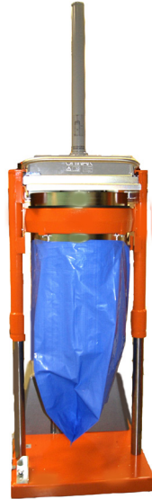
Standardhöhe für die Entleerung 2.660 mm

Als Top-Lader ist die Presse einfach zu befüllen. Sie ist sicher und einfach zu bedienen und macht den Sackwechsel mit ihrer eingebauten Hebefunktion denkbar schnell und bequem.