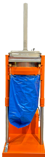
Standardhöhe für die Entleerung 2.660 mm

Als Top-Lader ist die Presse einfach zu befüllen. Sie ist sicher und einfach zu bedienen und macht den Sackwechsel mit ihrer eingebauten Hebefunktion denkbar schnell und bequem.