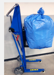
Die Orwak Hebekarre macht die Bedienung noch bequemer und Schluss mit schwerem manuellem Heben