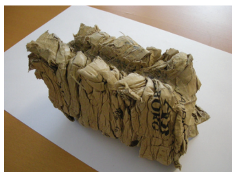
Kleines und kompaktes Brikett